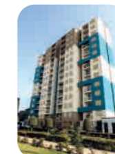
Edif. Parque Ruiz Breña