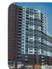
Edif. Ser-k 1era Etapa Barranco