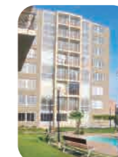
Cond. Santa Elvira Chiclayo