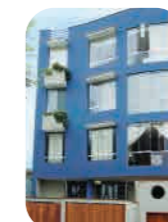
Edif. Atahualpa Miraflores