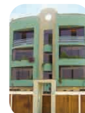
Edif. Trevor San Borja