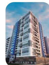
Edif. Like Jesús María