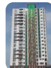
Edif. Parque la Reserva Santa Beatriz