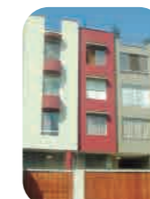
Edif. Inclán Miraflores