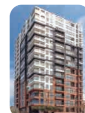
Edif. Lienzo Jesús María