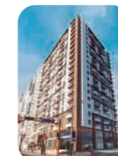
Edif. Ser-k 2da Etapa Barranco