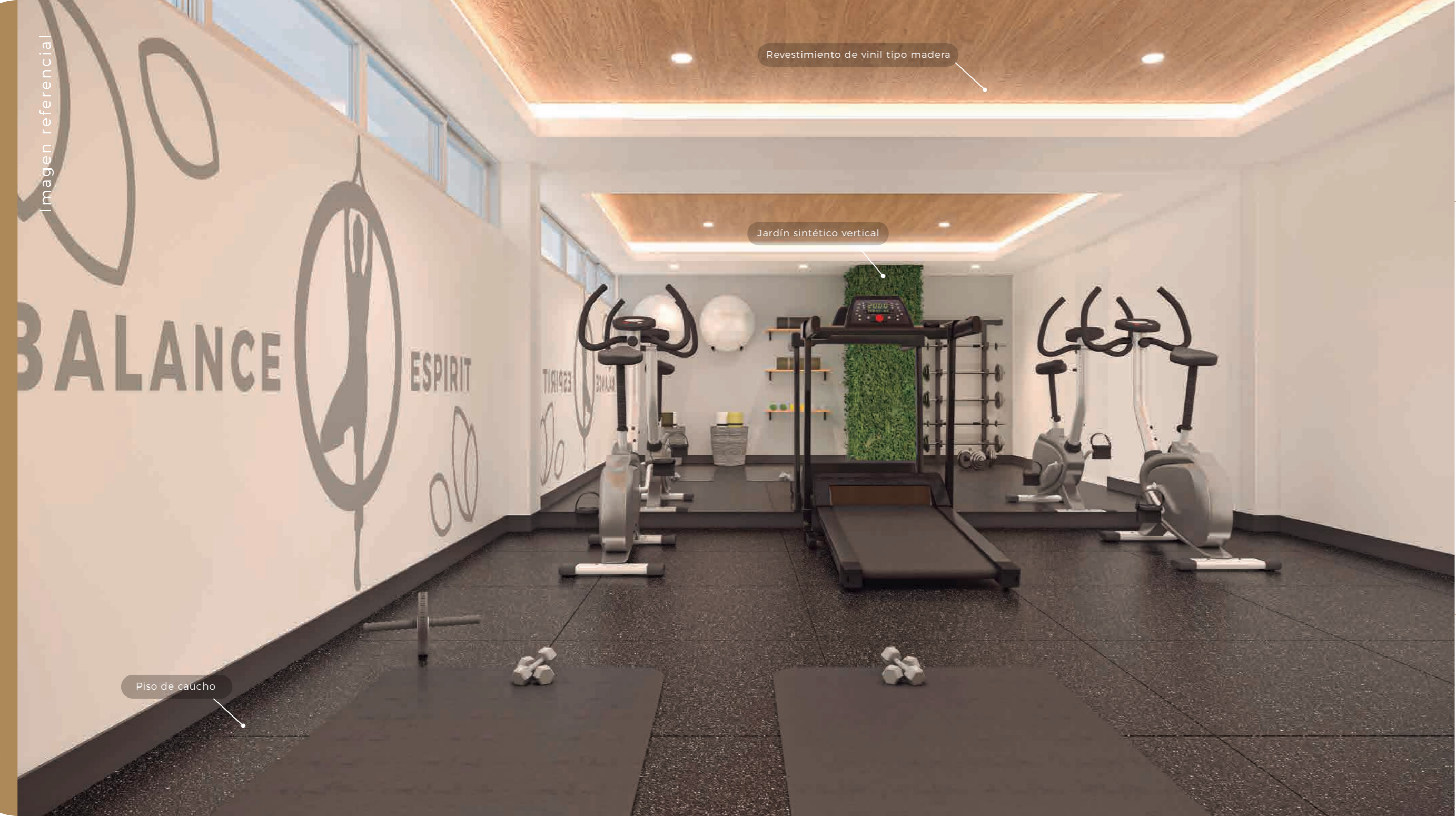
Revestimiento de vinil tipo madera