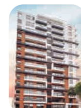
Edif. Qalma Lince