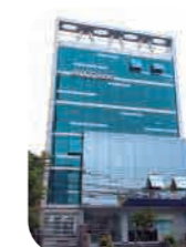
Edif. Efi100tech 2 San Isidro