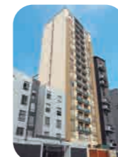
Edif. Olavegoya Jesús María