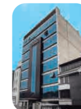
Edif. Efi100tech 1 Surco