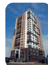
Edif. Shine San Miguel