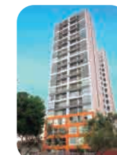
Edif. Liberpark San Miguel