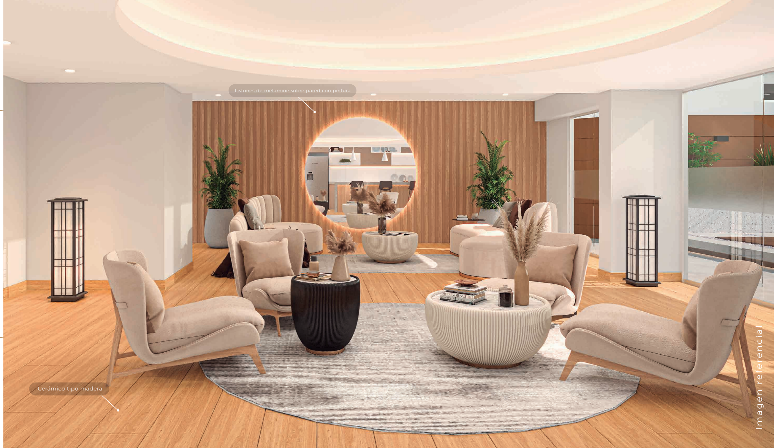
Listones de melamine sobre pared con pintura

Un ambiente cálido, iluminado y equipado, ideal para reuniones y celebraciones.