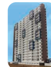
Edif. Barranco V.C. Barranco