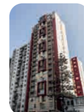
Edif. Buena Vista II Jesús María