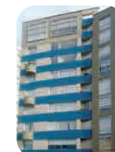
Edif. San Martín Miraflores