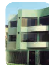
Edif. El Carmel Surco