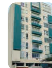
Edif. Vivenza Miraflores