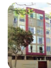
Edif. Dos de mayo Miraflores