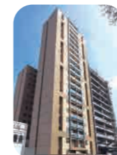
Edif. San Felipe Jesús María