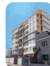
Edif. Central Lince