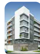
Edif. Módena Barranco