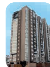
Edif. Buena Vista I Jesús María