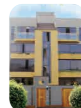
Edif. El Polo Surco