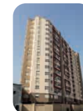
Edif. Sta. Cruz Jesús María