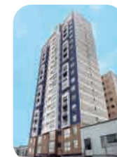
Edif. Club House Castilla Lince