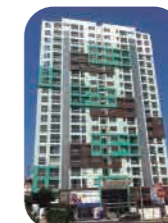
Edif. R. Viverd Pueblo Libre