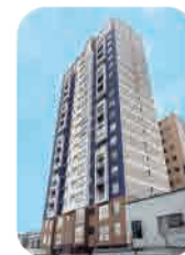
Edif. Club House Castilla Lince