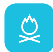
Sistema de detección de humo y temperatura