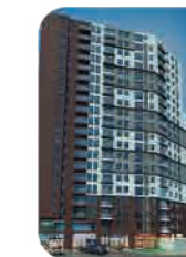
Edif. Ser-k 1era Etapa Barranco