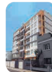
Edif. Central Lince