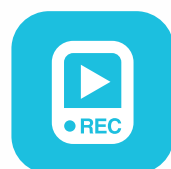
Grabador de video con CCTV