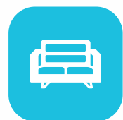
Áreas sociales amobladas