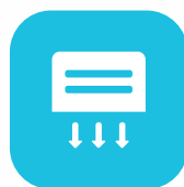
Escalera de evacuación ventilada