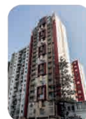
Edif. Buena Vista II Jesús María