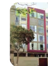
Edif. Dos de mayo Miraflores