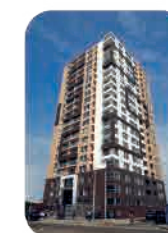
Edif. Shine San Miguel