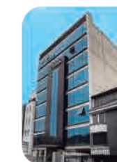
Edif. Efi100tech 1 Surco