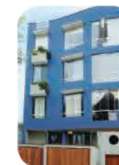
Edif. Atahualpa Miraflores