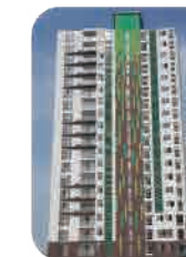
Edif. Parque la Reserva Santa Beatriz