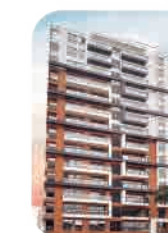
Edif. Qalma Lince