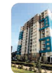
Edif. Parque Ruiz Breña