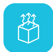
Sistema de extracción monóxido de carbono.