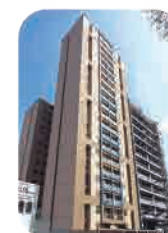
Edif. San Felipe Jesús María