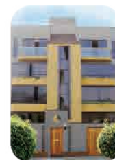
Edif. El Polo Surco