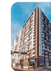
Edif. Ser-k 2da Etapa Barranco