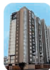
Edif. Buena Vista I Jesús María