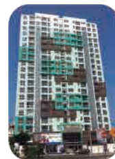
Edif. R. Viverd Pueblo Libre