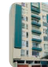
Edif. Vivenza Miraflores