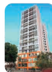
Edif. Liberpark San Miguel