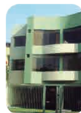
Edif. El Carmel Surco