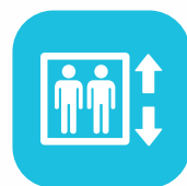
Ascensores con sistema de ahorro energético