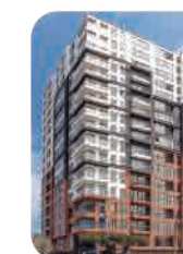
Edif. Lienzo Jesús María