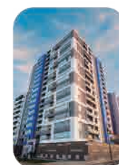
Edif. Like Jesús María