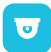
Cámaras de seguridad