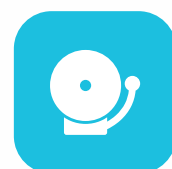
Alarma contra incendios