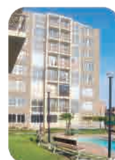
Cond. Santa Elvira Chiclayo