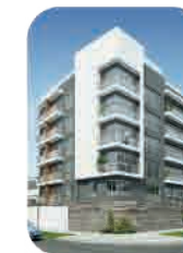
Edif. Módena Barranco