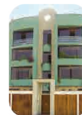
Edif. Trevor San Borja