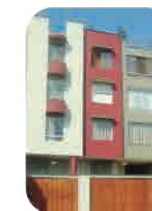
Edif. Inclán Miraflores