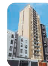
Edif. Olavegoya Jesús María