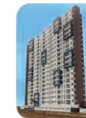
Edif. Barranco V.C. Barranco