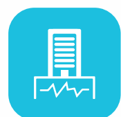
Edificio con estructura sísmo resistente

En Ciudadaris buscamos satisfacer las necesidades de vivienda de las familias, no sólo entregando el espacio físico del inmueble, sino también brindándoles un lugar donde puedan potenciar su hogar en un edificio de bienestar y confort, a través de espacios recreativos y sociales, los cuales cuentan con altos estándares de calidad y seguridad.