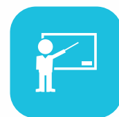
Charlas de capacitación