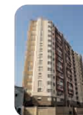
Edif. Sta. Cruz Jesús María