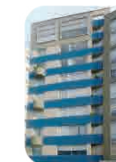
Edif. San Martín Miraflores