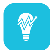
Medidor de luz