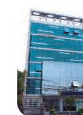
Edif. Efi100tech 2 San Isidro